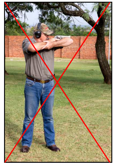
Nie toegelaat nie

18.4.4 Staanposisie met vrye ondersteuning - met hierdie gesteunde staanposisie kan die skut skietstokke gebruik na die beste van sy oordeel (kan ook meer as een poot van die skietstok benut) sonder enige beperking, behalwe waar die baanoffisier dit onveilig ag. Bv. die Bosveld skietoefening in die staanposisie met skietstokke, vrye ondersteuning op 100m.