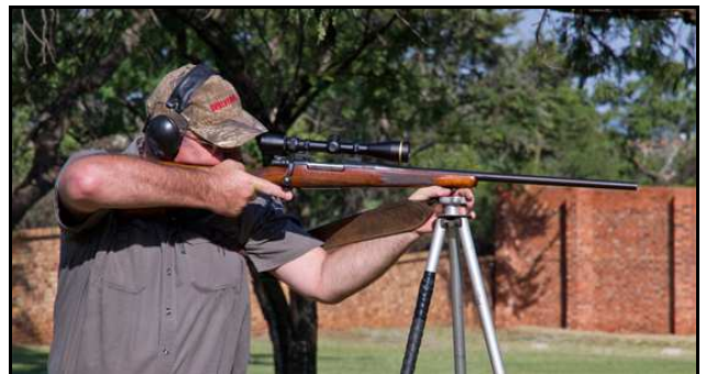
Alternatief bo-oor skietstokke