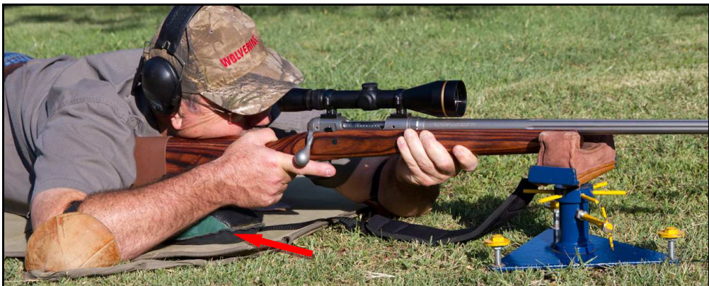
Toelaatbaar: sandsakke agter onder die kolf