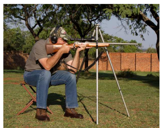
Alternatief met skietstoeltjie