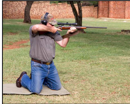
Alternatief - kniel op beide knieë

18.3.2 Knielposisie met vrye ondersteuning - knielposisie soos hierbo beskryf in item 18.3.1, maar die skut kan skietstokke gebruik na die beste van sy oordeel (kan ook meer as een poot van die skietstok benut) sonder enige beperking, behalwe waar die baanoffisier dit onveilig ag. Bv. die Bosveld skietoefening in die knielposisie met vrye ondersteuning op 150m.