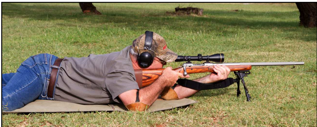
Alternatief met "Harris – bipod"