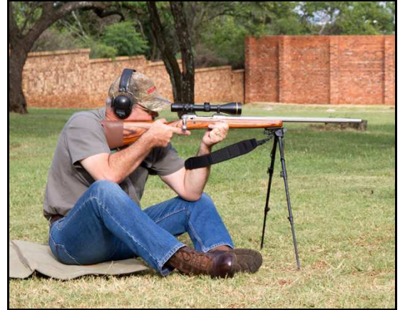
Alternatief met "Harris bipod"

Alternatiewe sitposisie op skietstoeltjie, maar met slegs een steunpunt op skietstokke - Bv. die Vlake skietoefening met 'n skietstoeltjie, maar met slegs een steunpunt op skietstokke op op 200m.