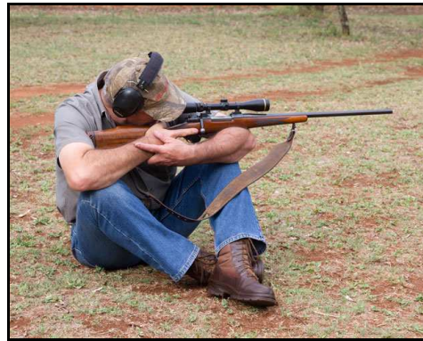
Alternatief: kolf teen bo-arm ( biceps muscle )

Alternatiewe sitposisie op skietstoeltjie sonder enige bykomende ondersteuning – Bv. die Rooibok skietoefening op 'n skietstoeltjie sonder ondersteuning op 100m.