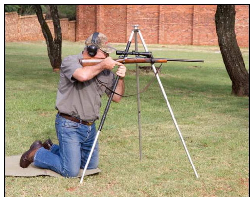
Alternatief – kniel op beide knieë